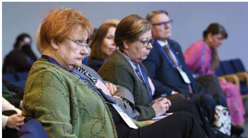
Presidentti Tarja Halonen