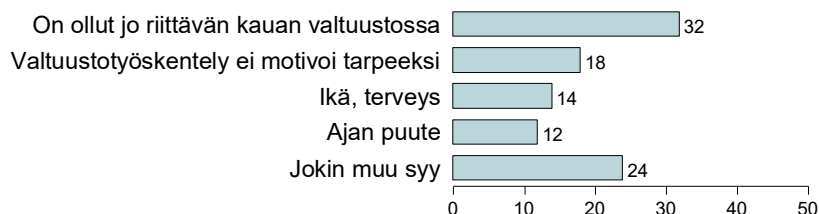
Kuvio 9. ENSISIJAINEN SYY, JOS EI LÄHDE EHDOKKAAKSI (%).

Kysely valtuutetuille / Kunnallisan kehittämissäätiö 2020