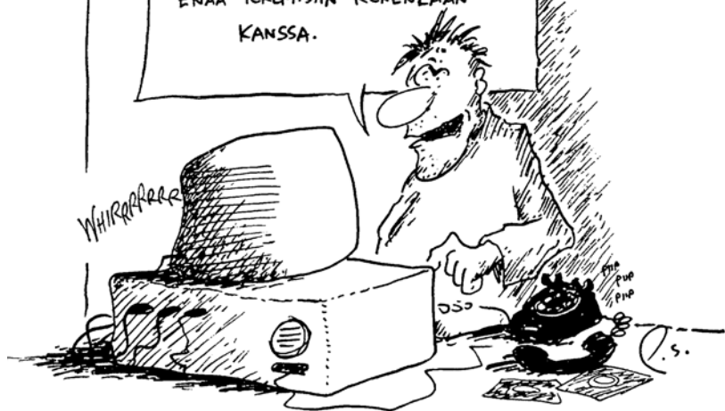
Pekka Saurin piirros vuodelta 1987.

NYT KUN PYSTYN MAKSAMAAN SÄHKÖLASKUTKIN MODEEMILLA, KAIKKI IHMISSUHDEONGELMANI OVAT RATKENNEET... EN JOUDU ENÄÄ TEKEMISIIN KENENKÄÄN KANSSA.