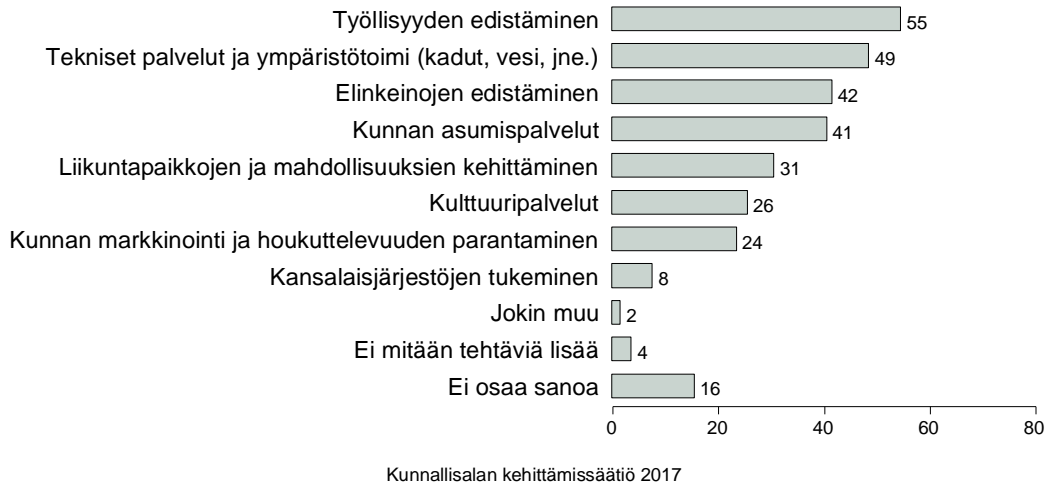
Kuvio 7/6. MISSÄ ASIOISSA KUNTIEN TULISI VASTAISUUDESSA LISÄTÄ TEHTÄVIÄ: ARVIOT SEN MUKAAN HALUAAKO UUSIA TEHTÄVIÄ SOTE-POISTUVIEN TILALLE VAIKO TEHOSTETTAVAN TOIMINTAA JÄLJELLE JÄÄVISSÄ TEHTÄVISSÄ (%).